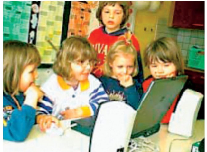
PC im Kindergarten

Im Teil A dieses Textes werde ich kurz sieben Argumente vorstellen, die meines Erachtens dafür sprechen, Medienbildung als eigenständiges Lern- und Themenfeld in Bildungskonzeptionen des Kinder-