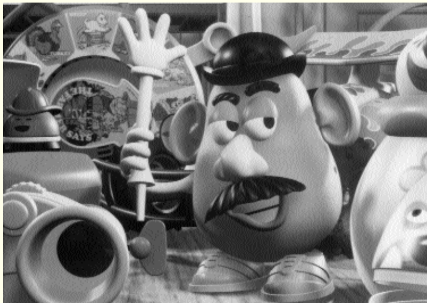
Mr. Potato Head kann seine Körperteile auch als Werkzeug benutzen. (Aus „Toy Story“)