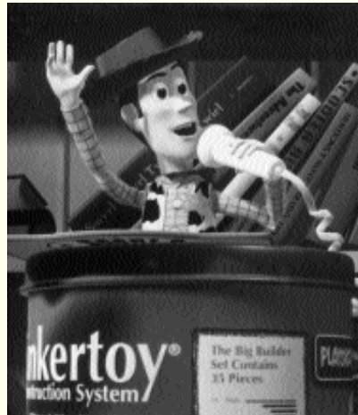
Woody hält als Anführer der Spielzeuge eine Rede im Kinderzimmer. (Aus „Toy Story“)

Bei „Free Willy“ taucht dieses Thema mit einer neuen Nuancierung auf. „Free Willy“ war lange Gesprächsthema der Jungen. Er hat vor längerer Zeit den Film zusammen mit einem Freund im Kino gesehen. Der Film „Free Willy“ bietet ihm nun Elemente des Bösen.