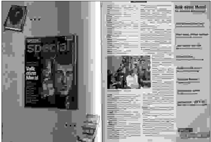
Werbung für „Spiegel-Special“ aus: DER SPIEGEL 1999, Heft 1, vom 4.1.1999, 116–117 bzw. Heft 2, vom 11.1.1999, 52–53.