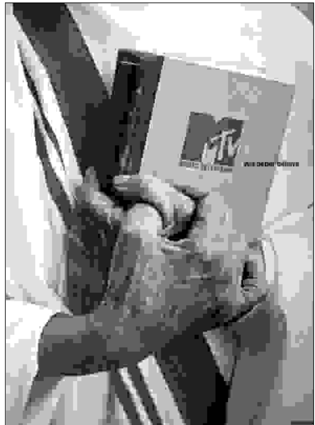
Werbung des Musik-Fernsehsenders Musictelevision (MTV) aus: TV-Today vom 12.04.2001.

Darüber hinaus wird bewusst durchaus auch auf Mutter Teresa als „Popikone“ angespielt, ein Image, das sie spätestens durch ihre inhaltliche Verbindung wie ihren zeitlich nahen Tod mit der Popikone Lady Diana 7 innehat. Lady Diana hatte in ihren letzten Le-