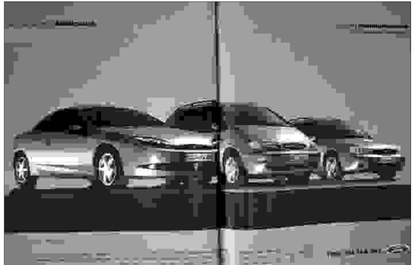
Ford-Werbung aus: DER SPIEGEL 1999, Heft 23, 221–223.

rechten Weg, zweimal im wörtlichen Sinn, einmal im übertragenen Sinn. Gleichwohl klingt die Überschrift nicht wirklich logisch; denn eigentlich müsste es heißen „viele Hilfsmittel führen auf den rechten Pfad“, aber das klänge wohl zu nüchtern. Hier wird schon (unter-)bewusst auf religiöse Sprache abgehoben – wie der Text der folgenden Doppelseite bestätigen wird. „Viele Wege führen ...“ setzen wir umgangssprachlich überlicherweise fort mit „... nach Rom“. „Weg“ ist ein biblisch besetzter Terminus – nicht nur über die Exodus- und Weg-Symbolik des Alten Testaments 3 , sondern auch vom Neuen Testament her: „Jesus Christus spricht: Ich bin der Weg, die Wahrheit und das Leben; niemand kommt zum Vater denn durch mich.“ (Joh 14,6). Und der „rechte Pfad“ klingt ebenfalls religiös und arachisch wie „Pfad der Erleuchtung“ o.Ä.