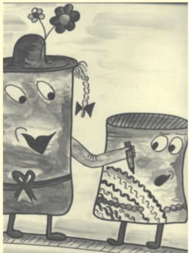
Klara Konserve zeigt Billy, was Werbung ist.

Mit Hilfe einer für die Kinder vertrauten Erzähl- und Vermittlungsform wird das Thema Werbung eingeführt bzw. aufgegriffen. Folgende Geschichte erzählt das Bilderbuch: Billy BÜchse, eine schlicht graue Konservendose, steht im Supermarktregal und ist nicht verkauft worden. Da erscheint Klara Konserve, eine schicke Spargeldose. Sie ist der Meinung, ohne Werbung sei es ja ganz logisch, dass er