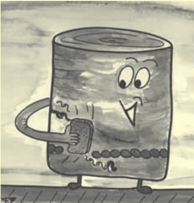
Billy wischt die „Werbung“ wieder weg.

Das Bilderbuch wird gemeinsam mit den Kindern angesehen und ihnen vorgelesen. Die Kinder haben ausreichend Zeit, die Bilder selbst zu beschreiben und eigene Assoziationen zu den Bildern zu entwickeln. Die offenen Gedankenblasen Billy Büchses am Ende des Buches sind besonders geeignet, die Kinder erzählen zu lassen, wie es Billy Büchse jetzt wohl geht, was er denkt und wie es vielleicht weitergehen könnte.