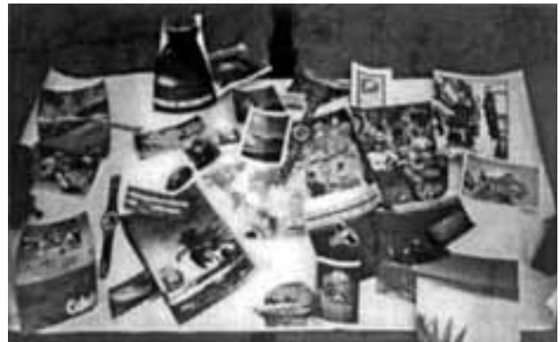
holidays and time