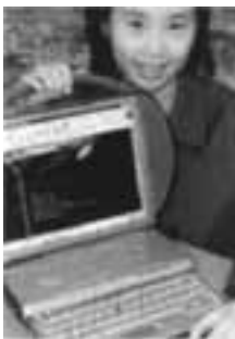
Schärfung kindlicher Wahrnehmung