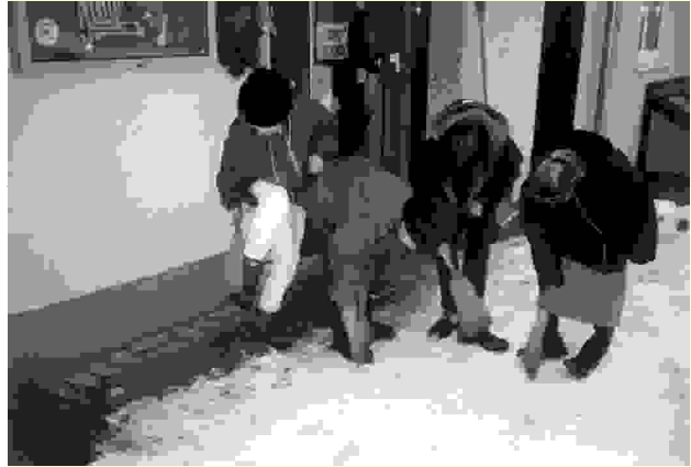
Kinder zeigen ihren afrikanischen Freunden, wie zur Winterzeit vor Betreten des Schulhauses die Winterstiefel gereinigt werden müssen.