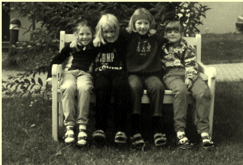
Stets begehrt – das „Fernsehbanker!“ in der VS Thomasroith OÖ.

In dieser für uns Lehrkräfte nicht leichten Situation erinnerten wir uns in einem Pausengespräch der Gepflogenheiten vergangener Tage und stellten ein solches „Gesprächsbanker!“ auf. Von Frühling bis Herbst lädt dieses Bankerl – es hat mittlerweile die Bezeichnung „FERNSEH-BANKERL“ von den Schülern bekommen – im Schulgarten, während der Winterzeit in einer gemütlichen Ecke im Schulhaus zum Erfahrungsaustausch und zum gemeinsamen Plaudern über Medienerlebnisse ein.