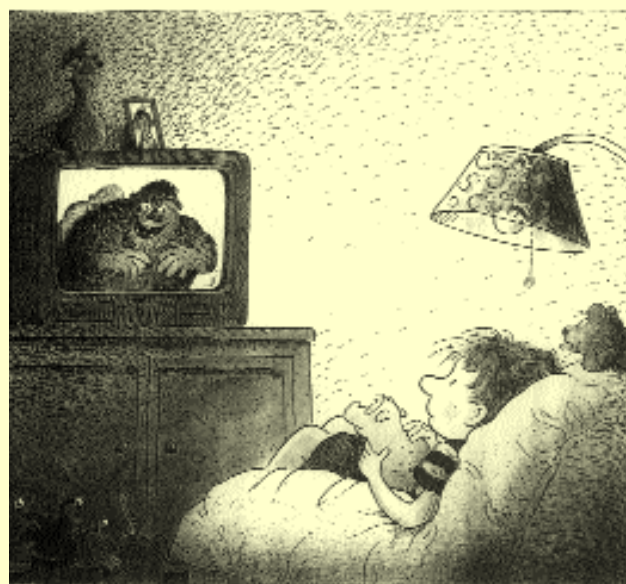
... und er hatte Angst beim Fernsehen.

Erhard Dietl beschreibt diese „alltäglichen Kinderängste“ nur vordergründig als typisch kindisch. Die Ende der 60er Jahre proklamierte Gleichberechtigung der Kinder und die Mediatisierung von Kindheit bedeutet auch ein Ende der kindlichen Unbe-