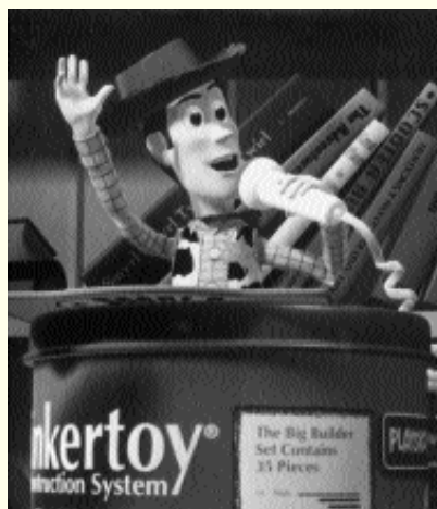
Woody hält als Anführer der Spielzeuge eine Rede im Kinderzimmer. (Aus „Toy Story“)

Bei „Free Willy“ taucht dieses Thema mit einer neuen Nuancierung auf. „Free Willy“ war lange Gesprächsthema der Jungen. Er hat vor längerer Zeit den Film zusammen mit einem Freund im Kino gesehen. Der Film „Free Willy“ bietet ihm nun Elemente des Bösen.