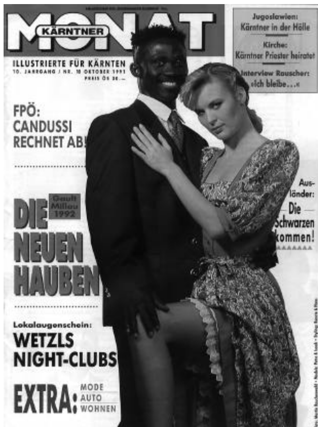
Titelseite der Zeitschrift: „Kärntner Monat“, Heft 10/Oktober 1991