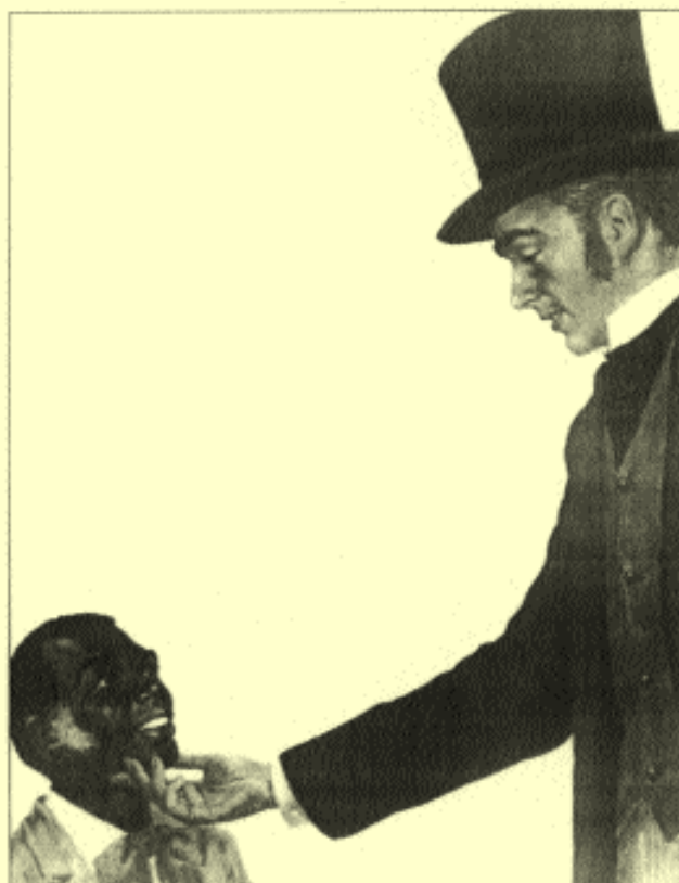
„Oh sicher Sir, ich werde alles tun!“ Beecher-Stows, Harriet. Onkel Toms Hütte. Illustration von Sani Stans, 1975.

Die Vorstellung reichten demnach vom kindlich unverdorbenen, drolligen Wilden bis zum bedrohlichen, zähnefletschenden Kannibalen, vom exotischen, bunt geschmückten Fabelwesen bis zum primitiven, unterentwickelten Sklaven oder zum armen