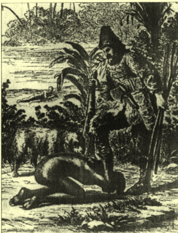
Robinson und der befreite Wilde

Es ist nicht zu bestreiten, dass die Durchsetzung von Kinder- und Jugendliteratur, ehe sie ihr eigentliches Publikum erreicht, zunächst einmal davon abhängt, ob sie den Erwartungen und ideologischen Präferenzen der Erwachsenenengesellschaft entspricht. Dies gilt vielfach für klassische Kinder- und Jugendbücher, wie z. B. Mark Twains „Tom Sawyer“ (1876), H. Beecher-Stowes „Onkel Toms Hütte“ oder R. Kiplings „Dschungelbuch“ (1894). Letzteres zeigt massiv kolonialistische, ja rassistische Züge, an die sich viele Fragen anknüpfen lassen: Mowglis Leben mit den Tieren, mit dem Bären Baloo und dem Panther Bagheera, der Pythonschlange Kaa und dem Wolfsrudel bleibt ja nicht bei der unschuldig-paradiesischen Gleichheit aller Kreaturen, wie es uns die Disney-Verfilmung glauben machen will. Im Buch wird völlig klar ausgesprochen, dass das Dschungelvolk