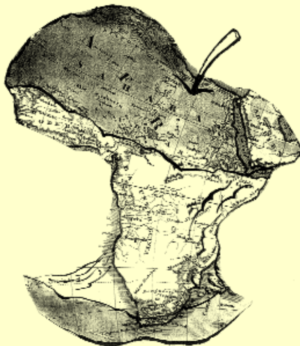
Das kolonisierte Afrika.

Aus: Gräbner, G.A. Robinson Crusoe. Für die deutsche Jugend bearbeitet. 12. Aufl., Leipzig, G. Gräbner, 1880.