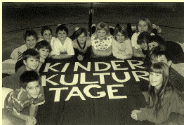
Bei der Vorbereitung der 3. Thomasroither Kinderkulturtage im April 1998 leisteten die Angebote der DRITTE-WELT-MEDIATHEK eine wertvolle Unterstützung: „Nacht der afrikanischen Märchen“, „Afrikanische Kindermesse“

Das Gesamtangebot der DRITTE-WELT-MEDIATHEK stellt derzeit einen Gesamtwert von ca. 39.000 S dar. Finanziert wurde das Projekt bislang durch Schulaktionen wie Nasch-, Bastel- und Flohmärkte, durch Preisgelder von prämierten Schulprojekten sowie durch Spenden von Institutionen und Einzelpersonen. Im Rahmen der Schulgemeinschaftsprojektförderung des Landes-schulrates für OÖ gab es zuletzt dafür auch eine Unterstützung.