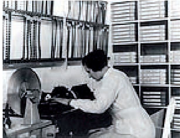
Leni Riefenstahl bei der Bearbeitung des Films http://de.wikipedia.org/wiki/Triumph_des_Willens

Nur wenige Wochen nach seiner Uraufführung, im März 1935, sorgte Triumph des Willens für Zuschauerrekorde in