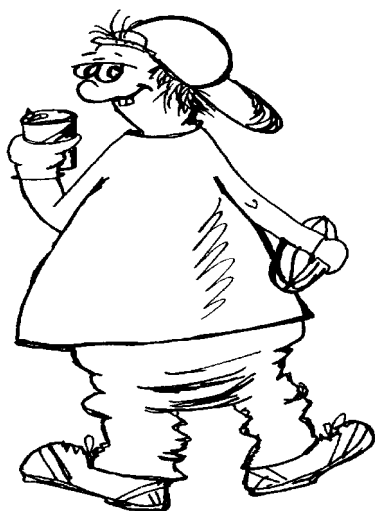
Sogenannter „Neuer Jugendlicher“

Mittelschichtsprache der Lehrer zu unterwerfen. Diese Sprachdifferenz zwischen Mittel- und Unterschicht ist heutzutage vergleichsweise gering angesichts der kulturellen Entwicklung in der konsumentorientierten Industriegesellschaft. In ihr dominiert die Differenz, und zwar als Folge zunehmender Individualisierung und der konsequenten Transformation von immer mehr Lebensbereichen in symbolische Formen, indem immer mehr zeichenhaft wird. Medialisierung oder Informationstechnologie sind hier relevante Stichwörter. Die neuen Erlebnis- und Ausdrucksformen von Kindern und Jugendlichen, ihre merkwürdigen Lebens- und Kulturformen sind jedoch nichts anderes als ein Spiegel dieser Entwicklung, die sich, sicherlich noch sehr grob und mit viel zu spezialisiertem Vokabular, theoretisch skizzieren läßt.