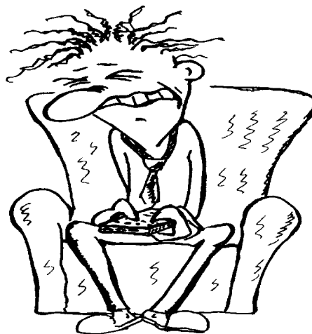
Gefühlsbetonter Entspannungssucher beim Mediensurfen

Ein zweites Beispiel für die sich abzeichnende neue Sozialstruktur der Szenen und Milieus, die sich über „ihre“ stilistisch passenden Elemente organisiert, ist die Zuschaueranalyse, die der Sender Pro7 1994 hat durchführen lassen. 3 Danach gliedert sich das Pro7-Publikum nicht nach der Dimension „oben/unten“, sondern in „Entspannungssucher“, „Mediensurfer“, „Gefühlsbetonte“ und „Actionfans“.