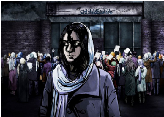
The Green Wave