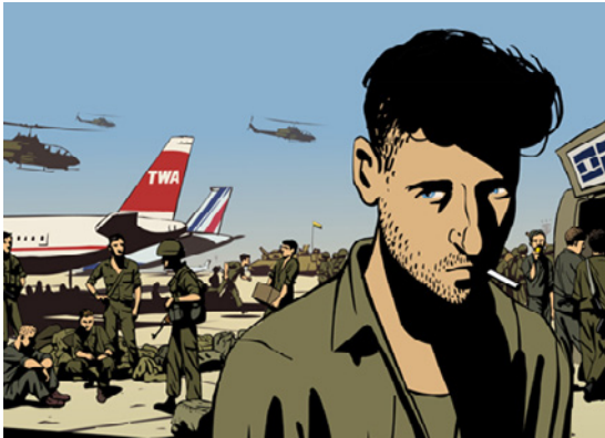
Waltz with Bashir