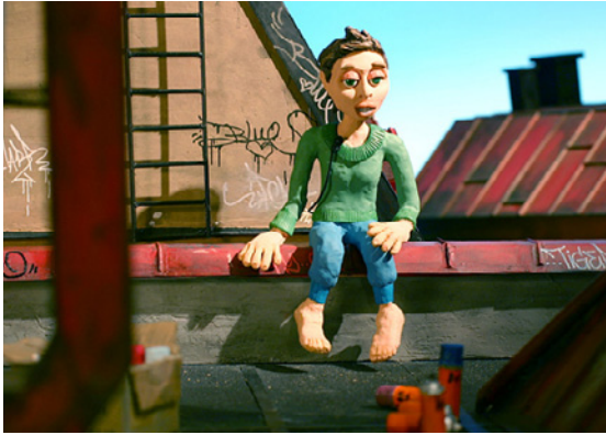
Blue, Karma, Tiger